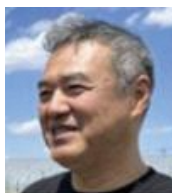
監督・撮影 柴田昌平

日本農業の「今」を現場から多角的に捉えた秀作。13組の農業者の日常の姿を追いながら、そこに通底する「百姓」共有の価値観を浮かび上がらせる構成に成功している。農業になじみがない人でも親しみやすく、都市住民を農の世界に誘い理解を深める入り口としての立場を意識した作りになっている。(農政ジャーナリストの会)